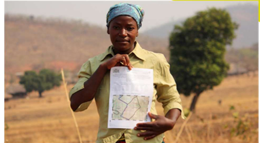
A woman holding her land certificate in rural Zambia.

gODAN ACTION Global Open Data for Agriculture & Nutrition